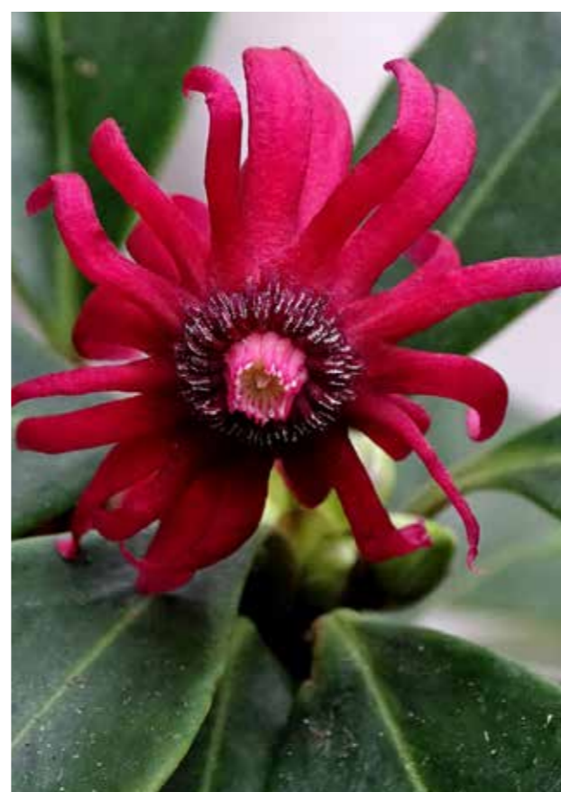
Illicium floridanum in de wintertuin (links onder)